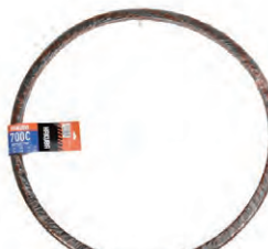
『HAKUBA TIRE』自転車タイヤ (700×25C)P1035 希望小売価格 ¥ OPEN ・700×25C ・一本巻 ・ブラック