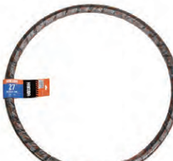
『HAKUBA TIRE』自転車タイヤ (26インチ)B003 希望小売価格 ¥ OPEN ・26×1 3 / 8 ・一本巻 ・ブラック