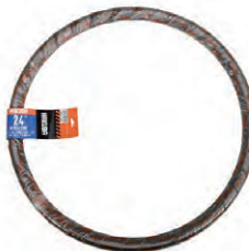
『HAKUBA TIRE』自転車タイヤ (24インチ)B003 希望小売価格 ¥ OPEN ・24×1 3 / 8 ・一本巻 ・ブラック