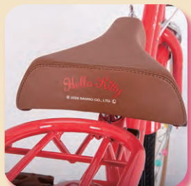
幅広テリヤサドル