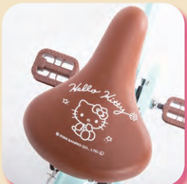
ハローキティロゴ入りサドル