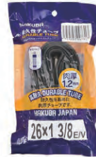
『HAKUBA TIRE』自転車チューブ 1.2mm(26インチ) 希望小売価格 ¥ OPEN ・26×1 3 / 8 ・英式バルブ ・ブラック