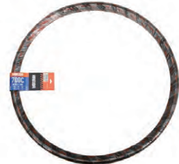
『HAKUBA TIRE』自転車タイヤ (700×32C) 希望小売価格 ¥ OPEN ・700×32C ・一本巻 ・ブラック