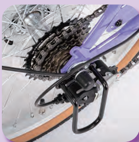
シマノ製外装6段変速