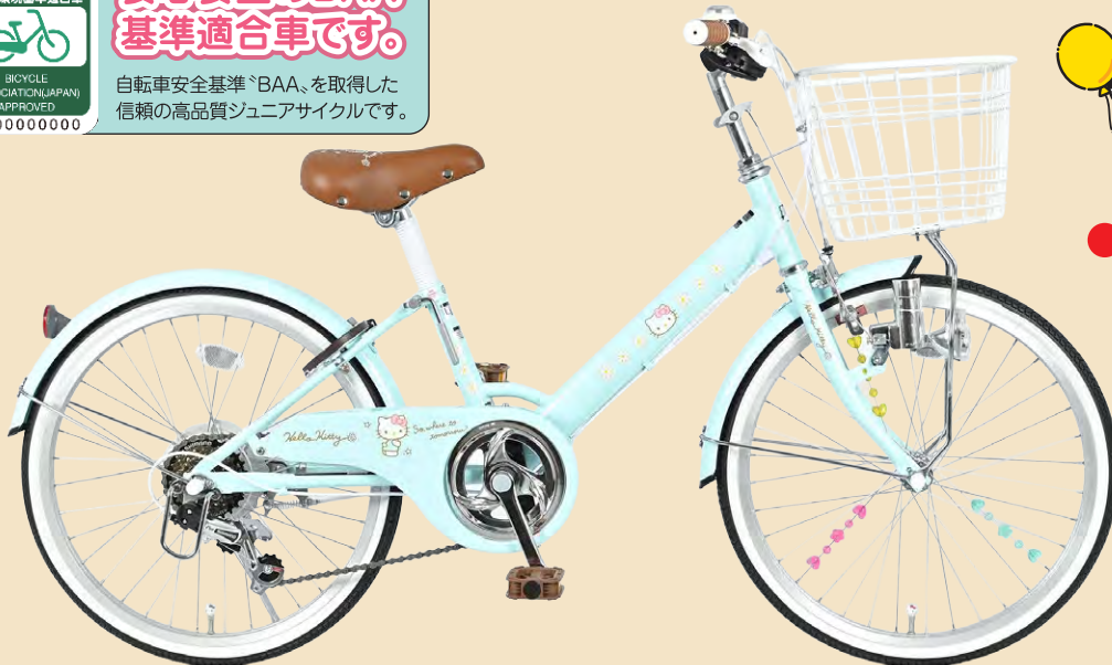
クラシックグリーン

© 2026 SANRIO CO., LTD. APPROVAL NO. L663029