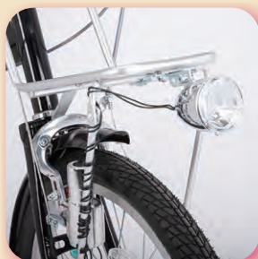
砲弾型ダイナモライト