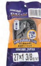
『HAKUBA TIRE』自転車チューブ 1.2mm(27インチ) 希望小売価格 ¥ OPEN ・27×1 3 / 8 ・英式バルブ ・ブラック