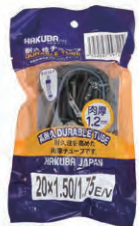
『HAKUBA TIRE』自転車チューブ 1.2mm(20インチ) 希望小売価格 ¥ OPEN ・20×1.50/1.75 ・英式バルブ ・ブラック