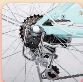
シマノ製外装6段変速