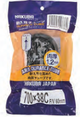
『HAKUBA TIRE』自転車チューブ 1.2mm(700×38C) 希望小売価格 ¥ OPEN ・700×38C ・仏式バルブ60mm ・ブラック