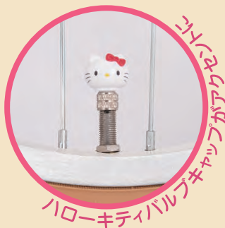
ハローキティバルブキャップ