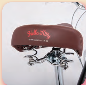
ハローキティロゴ入りサドル