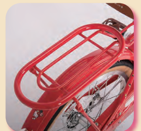
リアパイプキャリア