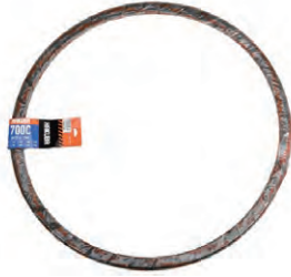
『HAKUBA TIRE』自転車タイヤ (700×28C)P1159 希望小売価格 ¥ OPEN ・700×28C ・一本巻 ・ブラック