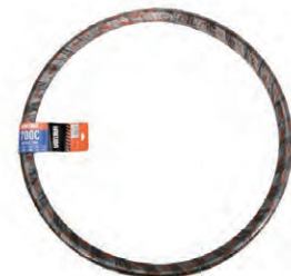
『HAKUBA TIRE』自転車タイヤ (700×35C)P1159/P1026 希望小売価格 ¥ OPEN ・700×35C ・一本巻 ・ブラック