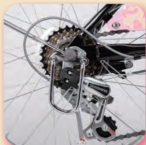
シマノ製外装6段変速