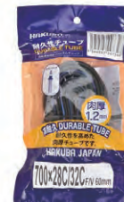
『HAKUBA TIRE』自転車チューブ 1.2mm(700×28C/32C) 希望小売価格 ¥ OPEN ・700×28C/32C ・仏式バルブ60mm ・ブラック