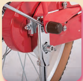
高さ調節機能付き