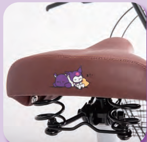
クロミロゴ入りサドル