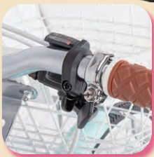
使いやすいシフター