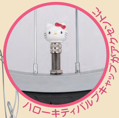
マイクロクラリアップキャリア ハローキティバルブキャップ