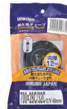
『HAKUBA TIRE』自転車チューブ 1.2mm(700×28C/32C) 希望小売価格 ¥ OPEN ・700×28C/32C ・英式バルブ48mm ・ブラック