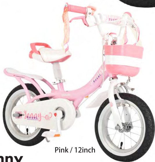
Pink / 12inch