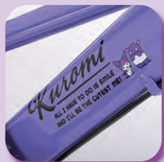
ちょっぴり大人なマーク