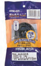
『HAKUBA TIRE』自転車チューブ 1.2mm(700×23C/25C) 希望小売価格 ¥ OPEN ・700×23C/25C ・仏式バルブ60mm ・ブラック