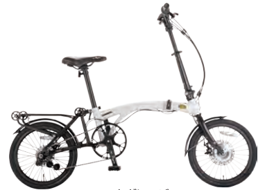
マットグレージュ