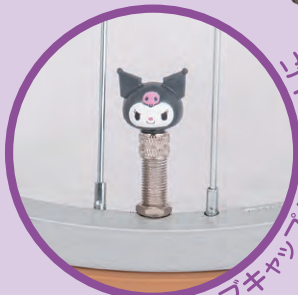
クロミバルブキャップがアクセント