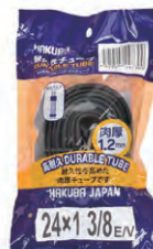
『HAKUBA TIRE』自転車チューブ 1.2mm(24インチ) 希望小売価格 ¥ OPEN ・24×1 3 / 8 ・英式バルブ ・ブラック