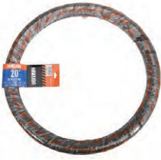
『HAKUBA TIRE』自転車タイヤ (20インチ)P1023/P1081 希望小売価格 ¥ OPEN ・20×1.75 ・一本巻 ・ブラック