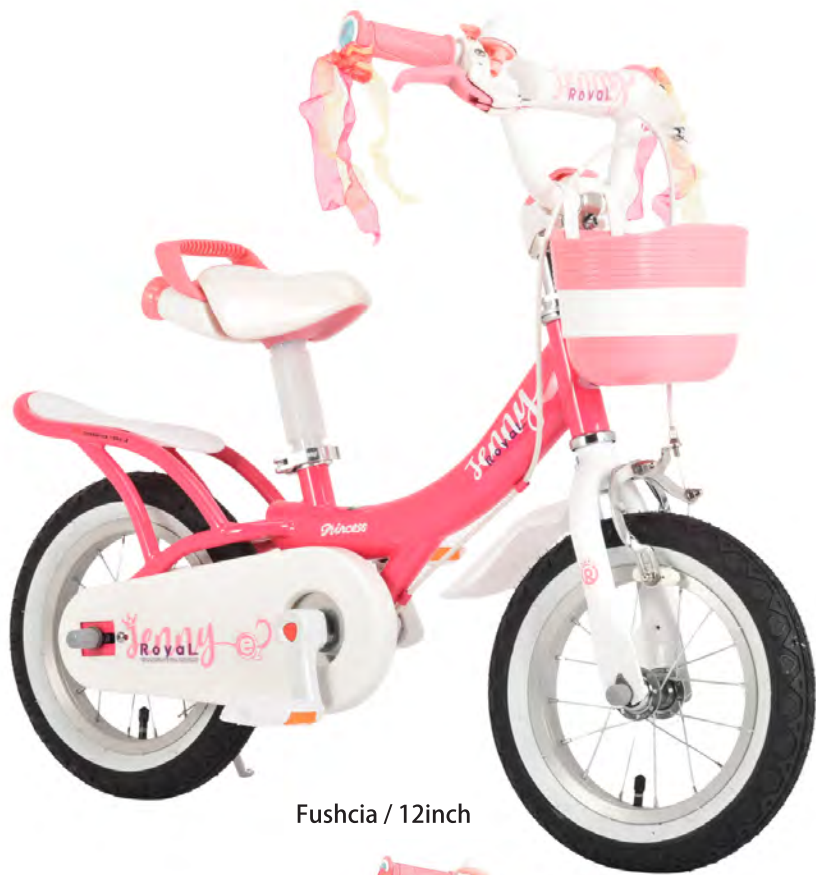
Fushcia / 12inch

工具不要でキックバイクからペダル自転車にワンタッチで変身 自在にストップアンドゴーが出来たらそのままペダルを付けて 自転車トレーニングができます